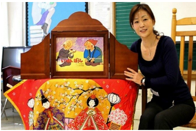
Légende : À la découverte du kamishibai avec Archipel.

Pour raconter l'histoire, le conteur utilise des planches cartonnées. Pour préparer sa prestation, il place les planches dans le butai en les introduisant par la glissière. Il ouvre les deux volets latéraux pour assurer la stabilité de l'ensemble. Il peut poser le butai sur une table. Dans le Japon d'autrefois, il était souvent à l'arrière d'un vélo. Puis, le conteur retire les planches au fur et à mesure du récit.