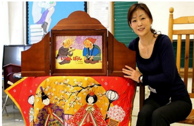
Photo de presse Vosges Matin, 2021. Légende : À la découverte du kamishibai avec Archipel.

Pour raconter l'histoire, le conteur utilise des planches cartonnées. Pour préparer sa prestation, il place les planches dans le butai en les introduisant par la glissière. Il ouvre les deux volets latéraux pour assurer la stabilité de l'ensemble. Il peut poser le butai sur une table. Dans le Japon d'autrefois, il était souvent à l'arrière d'un vélo. Puis, le conteur retire les planches au fur et à mesure du récit.