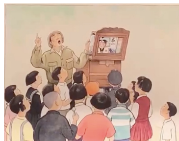
Image issue de l'album Le bonhomme kamishibai , d'Allen Say, 2006

Le butai fermé suscite immédiatement la curiosité du public, enfants comme adultes. Mais la première image n'est dévoilée qu'après une formule rituelle. Ensuite, le conteur peut rendre le récit très vivant pour captiver ses spectateurs. Pour cela, il peut faire glisser lentement ou rapidement les planches des illustrations pour créer des effets de surprise ou de vitesse. Il peut utiliser une voix forte, une petite voix, une voix menaçante, une voix douce ou une voix grave ou une grosse voix pour exprimer les émotions des personnages. Il peut parler plus ou moins fort et jouer un rôle, presque comme un clown. Parfois, le conteur rajoute des bruitages ou un fond sonore.